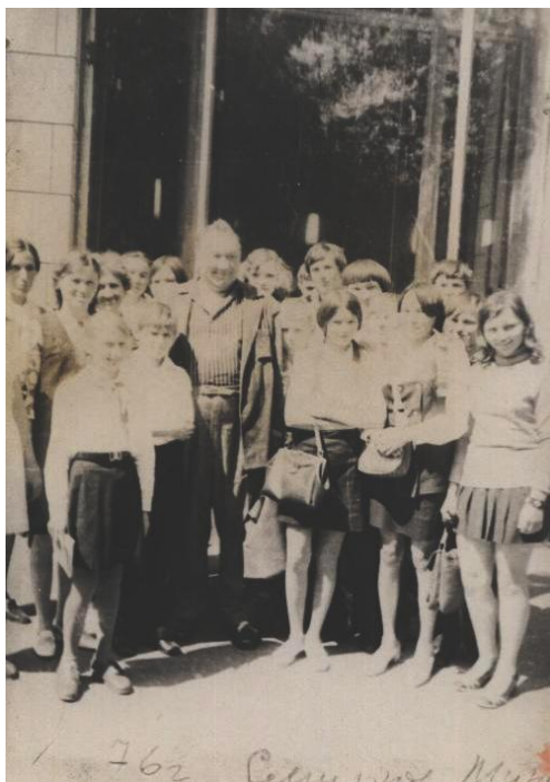
Фото 1. Встреча с артистом Алексеем Смирновым