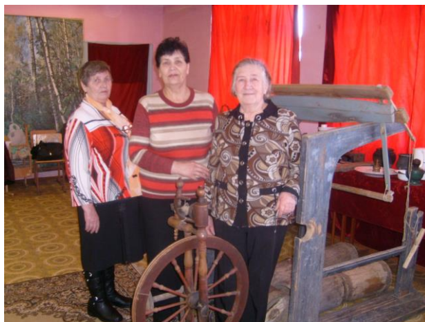
Фото 5. Встреча