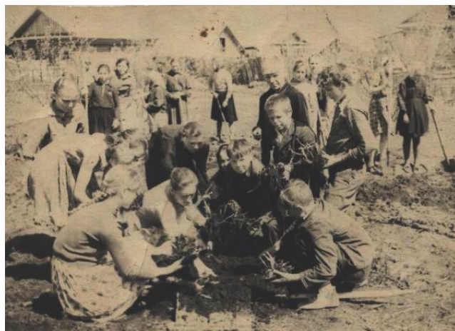
Фото 2. Закладка опытов на пришкольном участке. 60-е годы XX века