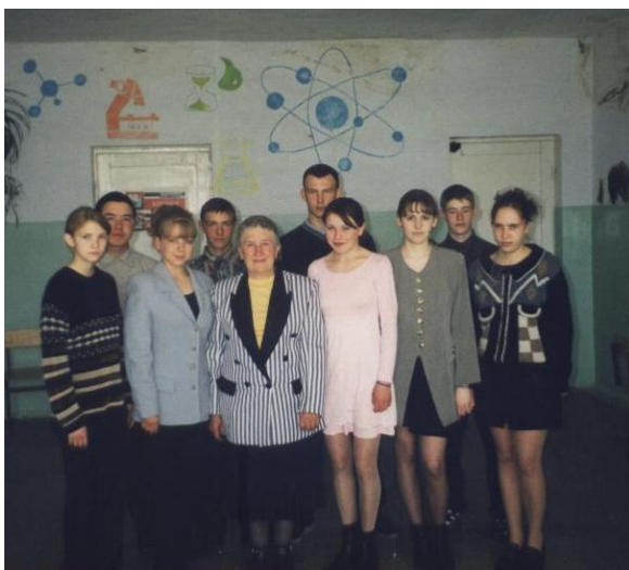
Фото 4 . Встреча с учащимися школы