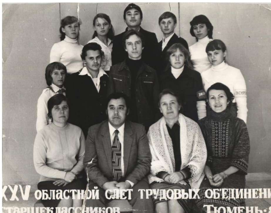
Фото 3. Областной слет трудовых объединений