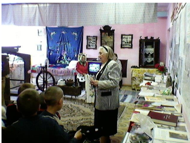
Фото 7. Все своими руками.