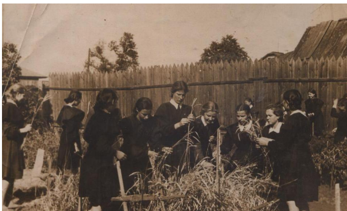
Фото 2. На пришкольном участке 10 класс, 1952 год